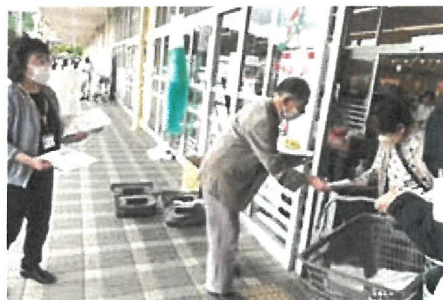
ヨークベニマル棚倉店

全国民生児童委員連合会では、毎年5月12日の民生児童委員の日から一週間を「民生児童委員の日活動強化週間」と定めております。棚倉町では毎年、ヨークベニマル棚倉店、エコス棚倉店にて棚倉警察署の皆さんの啓発運動と一緒に民生児童委員PR活動（ボールペン、ポケットティッシュ、チラシ等配布）を行っています。