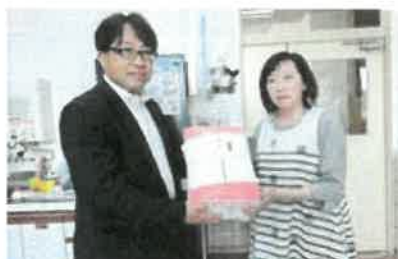
【発達支援センターたなぐら】