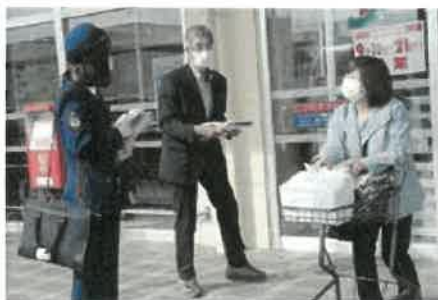
ヨークベニマル棚倉店

全国民生児童委員連合会では、毎年5月12日の民生児童委員の日から一週間を「民生児童委員の日活動強化週間」と定めております。棚倉町では毎年、ヨークベニマル棚倉店、エコス棚倉店にて棚倉警察署の皆さんの啓発運動と一緒に民生児童委員PR活動（ボールペン、ポケットティッシュ、チラシ等配布）を行っています。