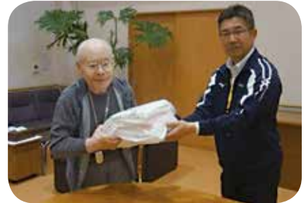
老人保健施設志宝台 様

♥未使用のタオルを募集しています。連絡いただければ取りに伺います。☎33-2623