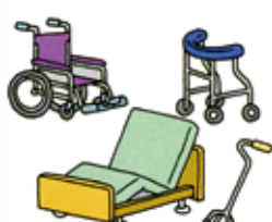
福祉用具レンタル