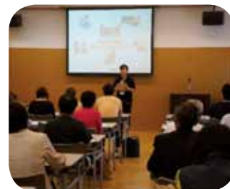
※ 地域包括支援センター 7ページもご覧ください。

社会福祉協議会は地域福祉の要として、多くの人々の善意に支えられ、福祉事業活動を行っています。住み慣れた町（地域）で安心して、生活できるよう、みんなで互助の心をはぐくみ、支え合い、福祉の「まちづくり」を推進しましょう。