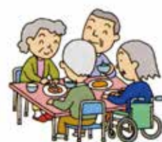
短期入所生活介護