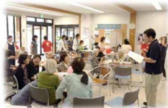
たなちゃんカフェの様子

また、たなちゃん体操サポーターによる介護予防体操、亀楽の会の方とお手玉や折り紙を行い、皆さんで楽しく過ごしました。