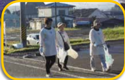
棚倉町赤十字奉仕団の皆さん お疲れさまでした！